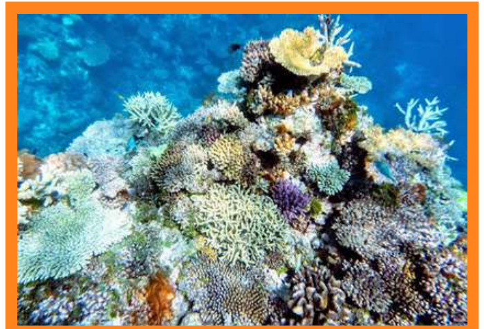
图3. 海洋酸化威胁着珊瑚礁