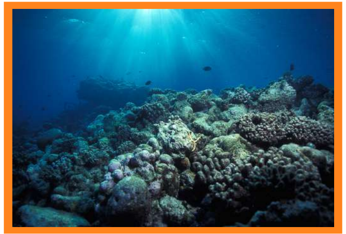
图2. 珊瑚礁显示了酸化的影响。